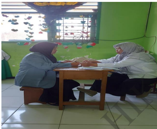
Observasi bersama guru kelas 2B