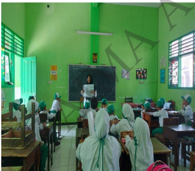
Pembelajaran di Kelas 2b Menggunakan Media Big Book