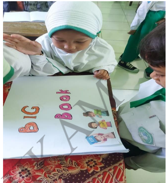
Siswa 2B Membaca dengan Media Big Book