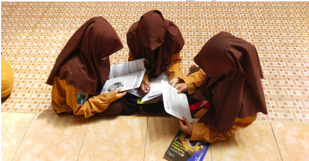
Gambar 10 : Suasana diskusi kelompok ahli siklus 2 (luar ruangan)