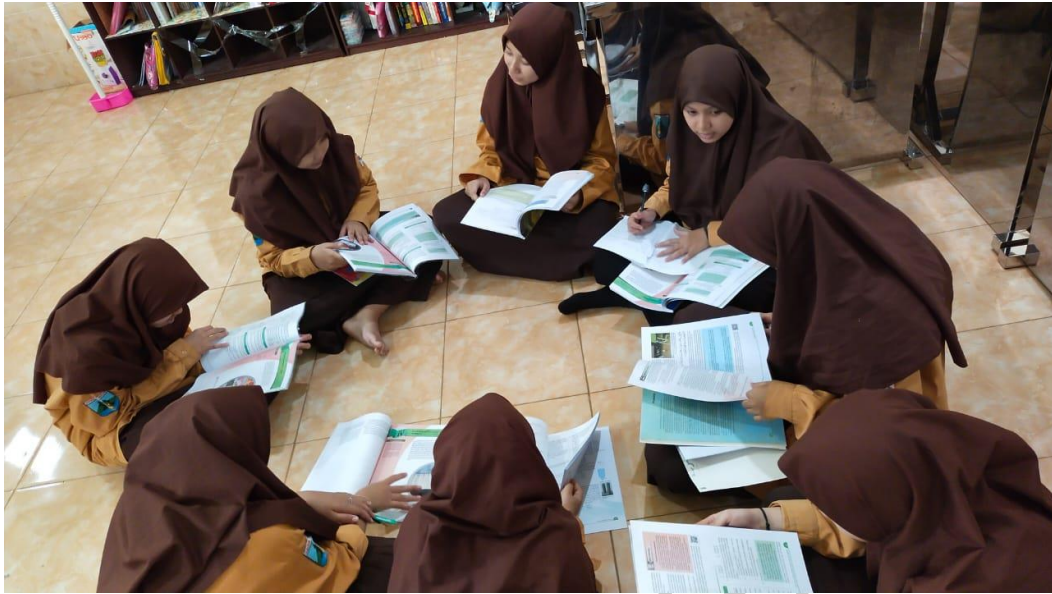
Gambar 7 : Suasana diskusi kelompok asal siklus I (dalam ruangan)