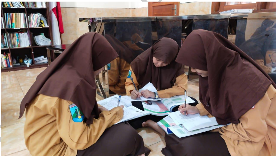
Gambar 8 : Suasana diskusi kelompok ahli siklus I (dalam ruangan)