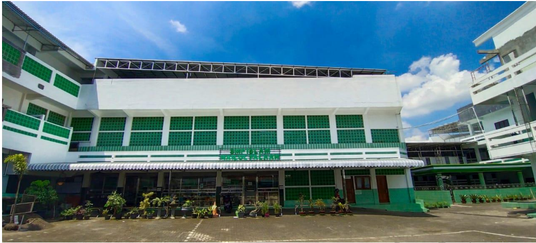
Gambar 3 : Tampak luar gedung SMP Islam Nailul Falaah