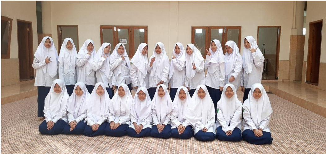
Gambar 5 : Objek penelitian siswa kelas VIII-A