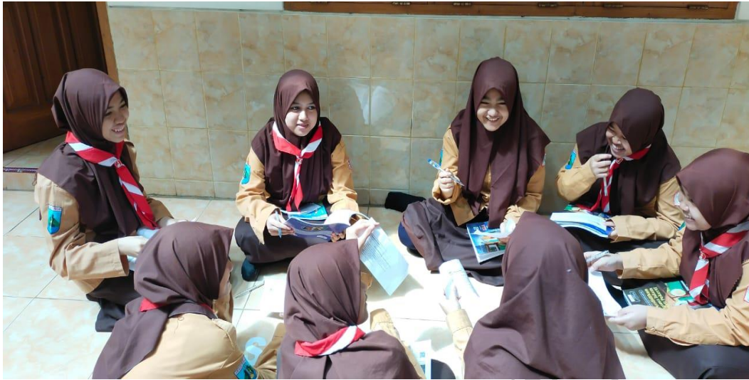
Gambar 9 : Suasana diskusi kelompok asal siklus 2 (luar ruangan)