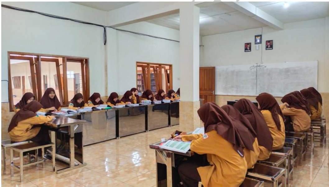
Gambar 6 : Suasana Kelas VIII-A