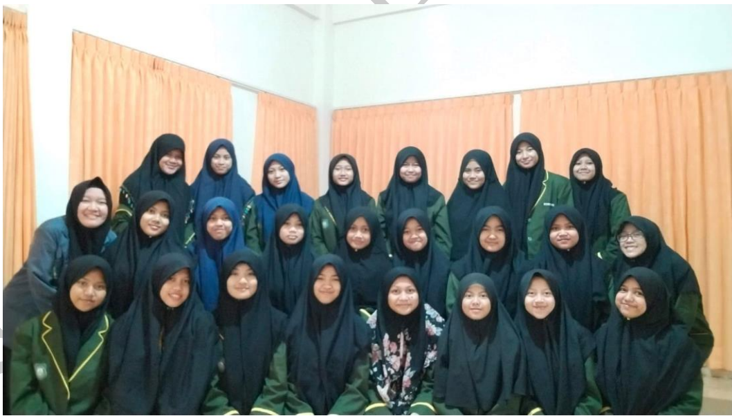
Gambar 12 : Foto peneliti bersama kelas VIII-A