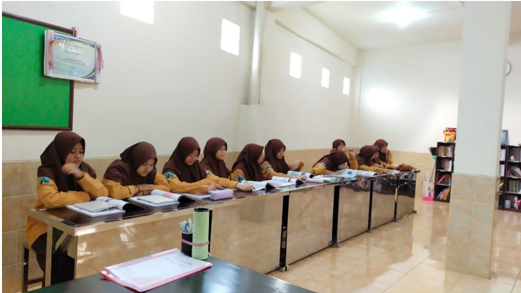
Gambar 11 : Suasana kelas saat mengerjakan post test