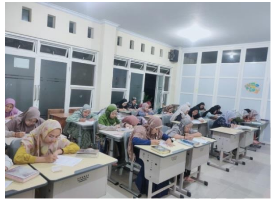
Pengisian Angket di Pondok Pesantren Nurul Ulum Putri Kebonsari