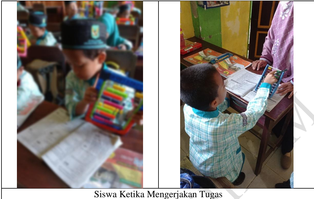
Siswa Ketika Mengerjakan Tugas