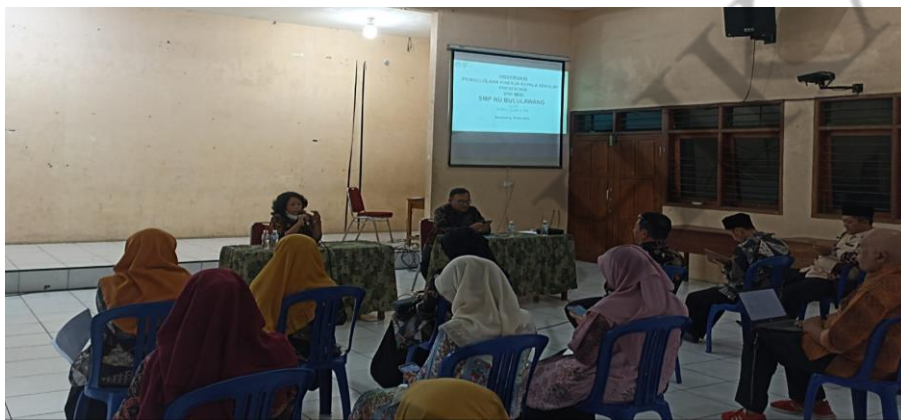
Foto Kegiatan Workshop