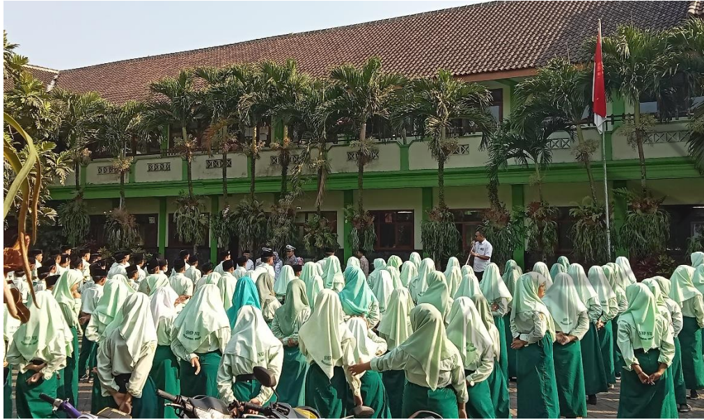
SMP NU Bululawang, Bapak Kepala Sekolah Beserta Peserta Didik