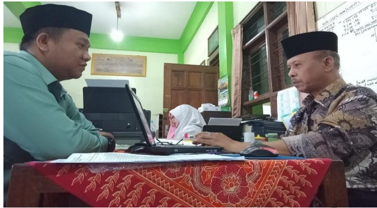
Wawancara dengan peserta didik SMP NU Bululawang