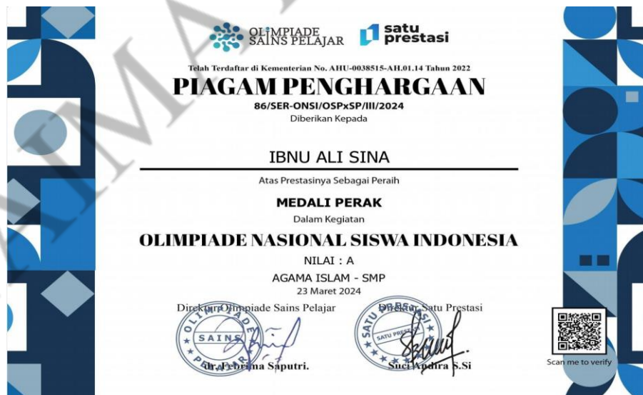
Piagam Siswa berprestasi PAI

Observasi sekaligus wawancara dengan kepala sekolah, Guru PAI, waka kurikulum, waka kesiswaan dan waka yang lain