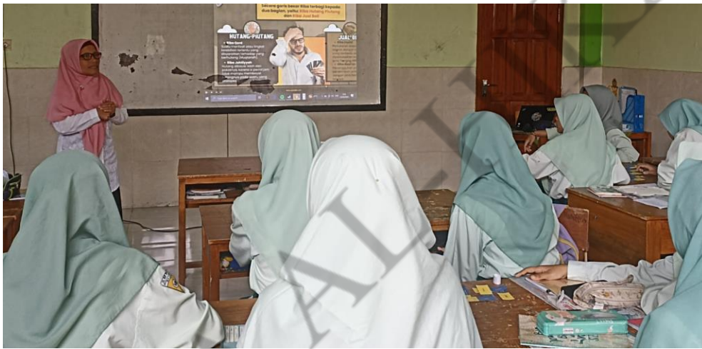
Pembelajaran CTL yang dilakukan guru PAI SMP NU Bululawang Dengan menggunakan menggabungkan Gambar PPT & Video untuk menjelaskan materi