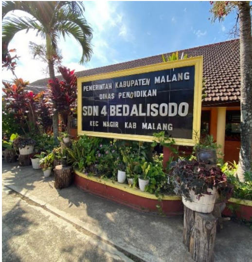
(Papan Nama Sekolah)