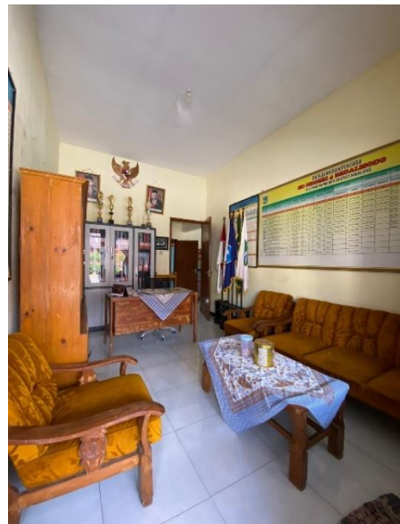
(Ruang Kepala Sekolah)