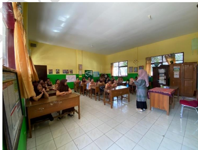
(Kegiatan Pembelajaran dengan Penerapan Kurikulum Merdeka)