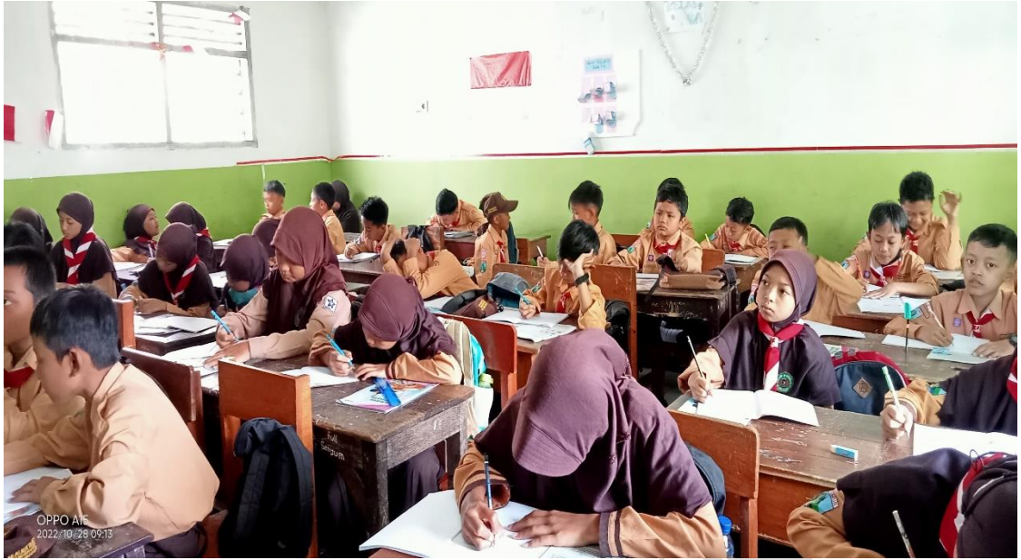
Gambar. 6 Belajar di kelas