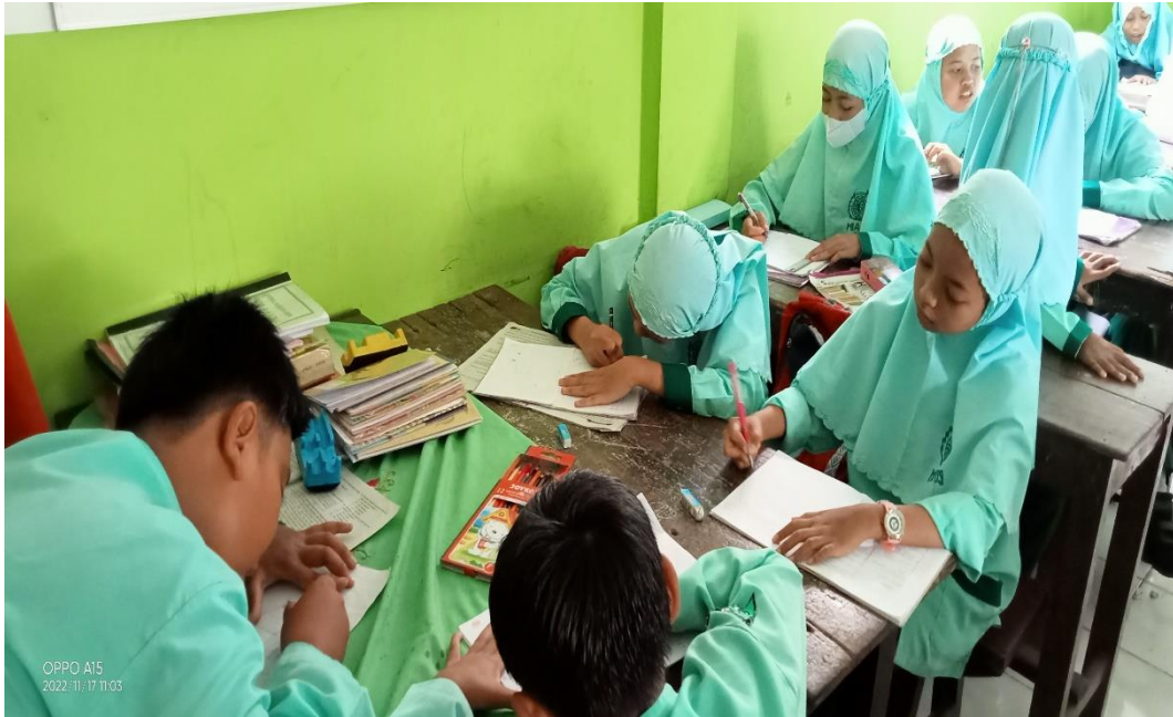
Gambar. 2 Pembentukan kelompok jigsaw