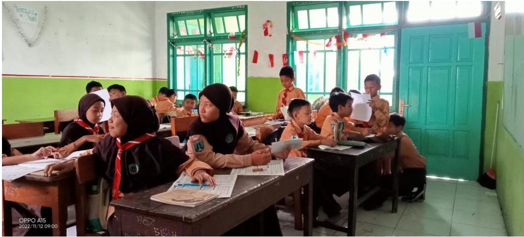
Gambar. 4 Validasi Angket