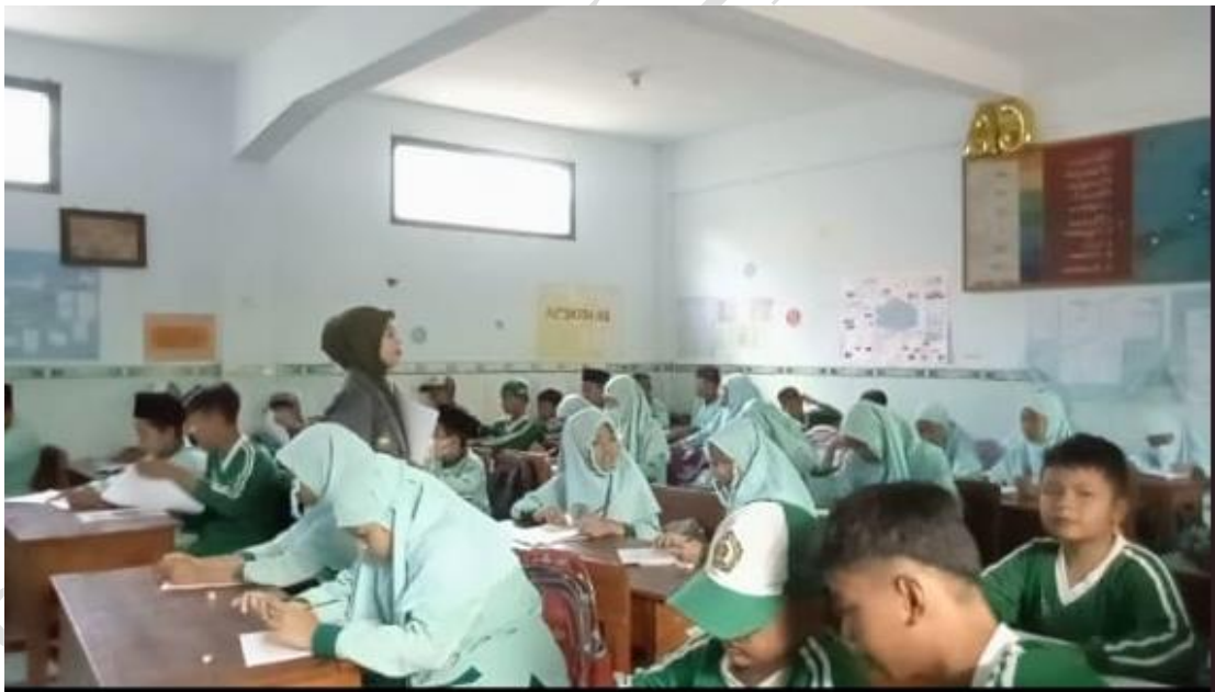
Gambar. 5 Pemberian Angket