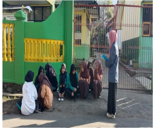
Gambar siswa yang melanggar peraturan