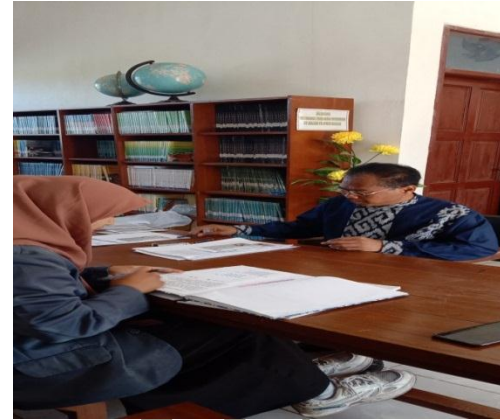
Gambar wawancara dengan kepala sekolah