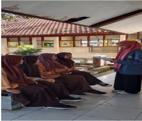
Gambar wawancara dengan siswa kelas 8 dan 9