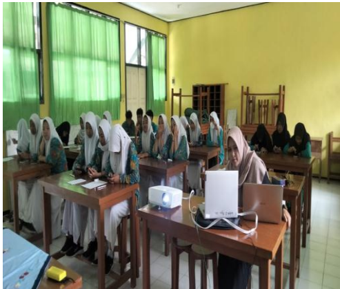
Gambar kegiatan pembelajaran didalam kelas