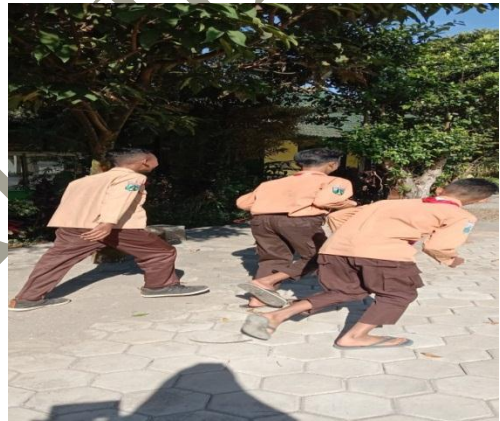
Gambar siswa yang sedang dihukum