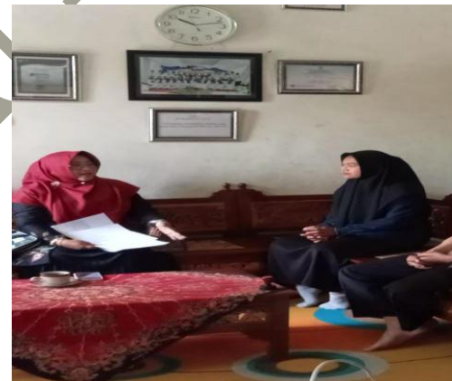
Gambar wawancara dengan guru kelas