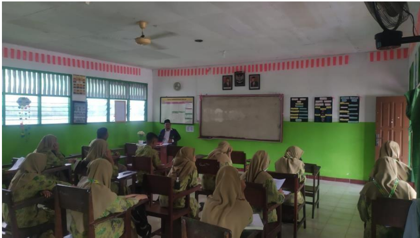
Pembelajaran dengan Model Problem Based Learning (PBL)