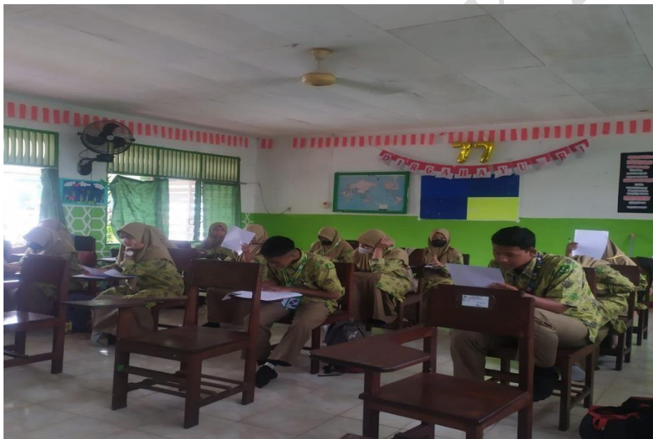
Kelas X IPA Mengerjakan Post Test