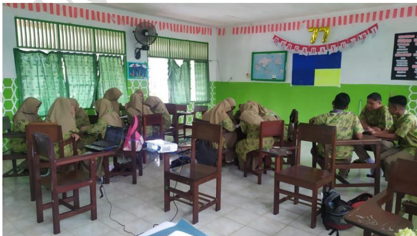
Diskusi Tentang Strategi Dakwah sesuai Ajaran Rasulullah SAW