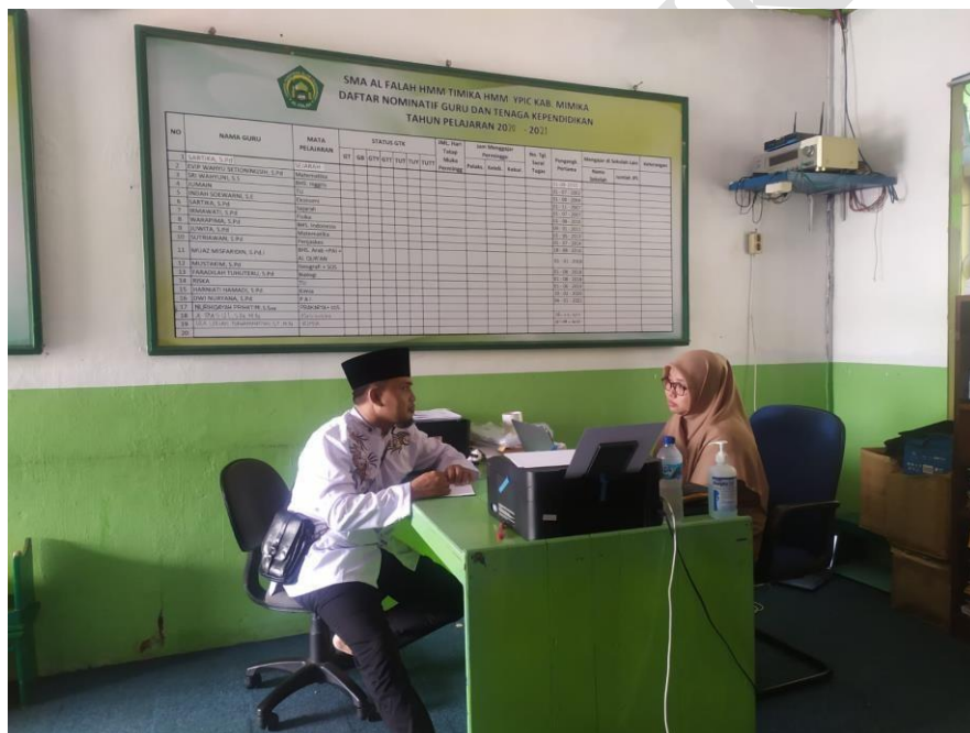
Konsultasi dengan Waka Kurikulum berkaitan Belajar Mengajar