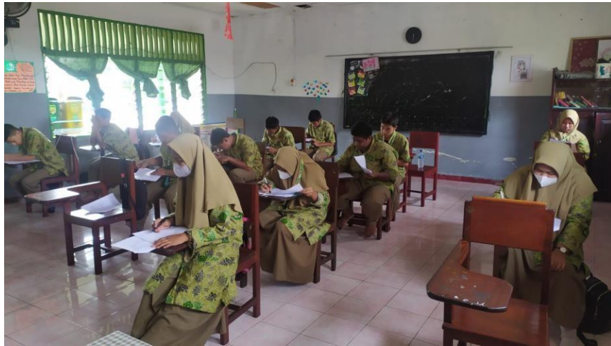
Mengerjakan Soal Koesioner