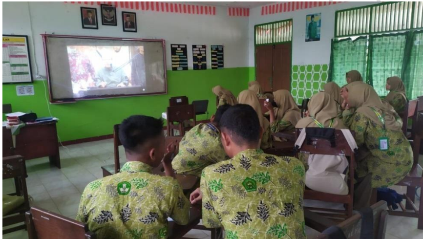
Mengamati Perbedaan Dakwah Rasulullah dan Dakwah Kontemporer