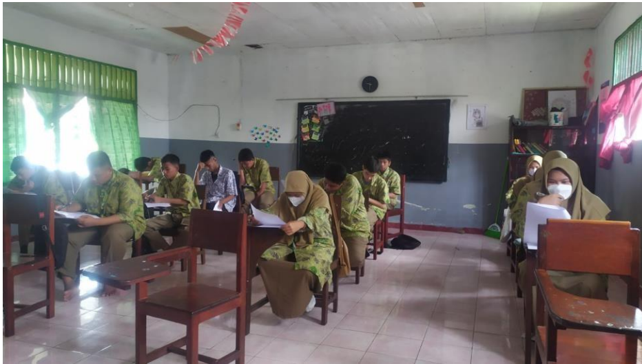
Kelas X IPS Mengerjakan Instrumen Postest