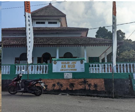
1.14 Masjid di Samping Sekolah