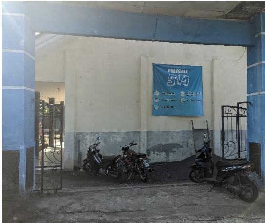
1.11 Gerbang Belakang Sekolah