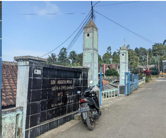
1.12 Gerbang Depan Sekolah