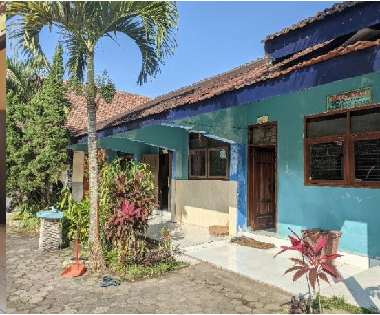
1.2 Ruang Guru dan Kepala Sekolah