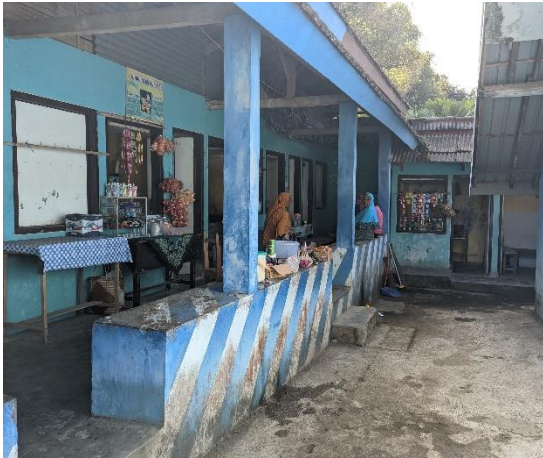
1.17 Kantin Siswa