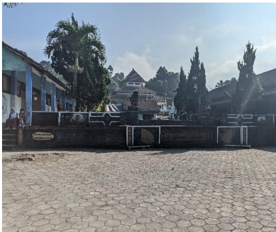
1.3 Halaman dan Panggung Serbaguna Sekolah