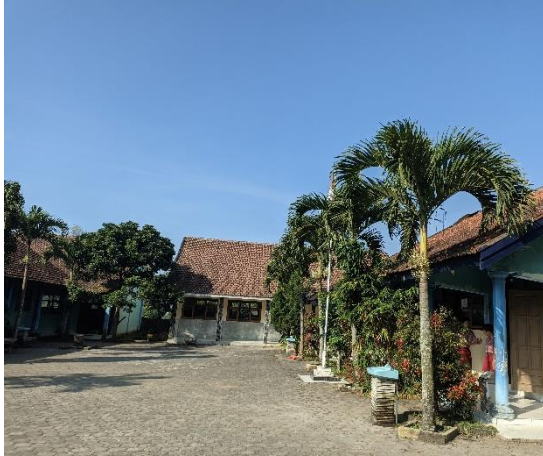
1.5 Halaman Depan Ruang Guru & Kepala Sekolah