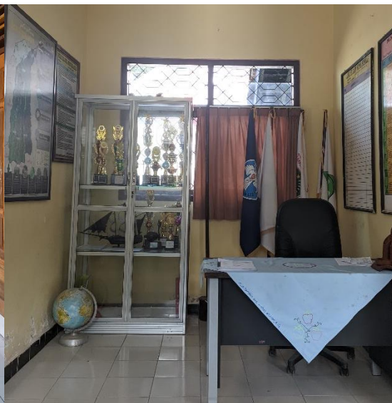
1.10 Ruang Kepala Sekolah