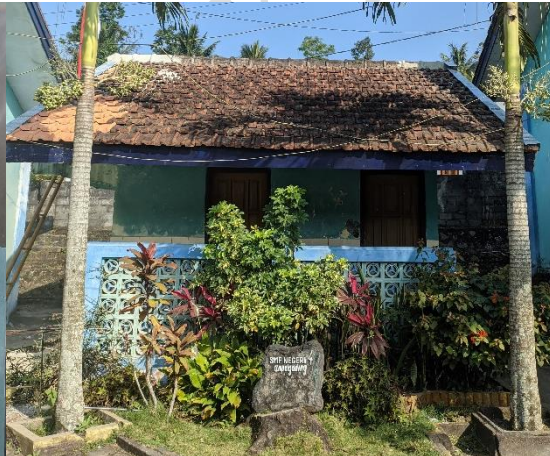
1.8 Kamar Mandi Guru