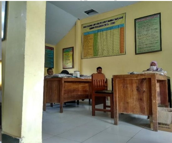
1.20 Ruang Guru