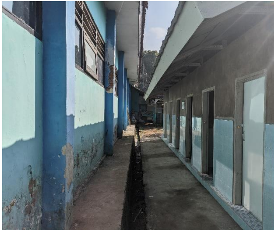
1.7 Kamar Mandi Siswa