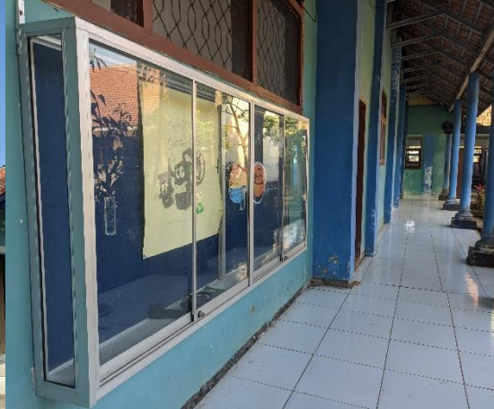
1.6 Lobi Depan Kelas & madding Sekolah