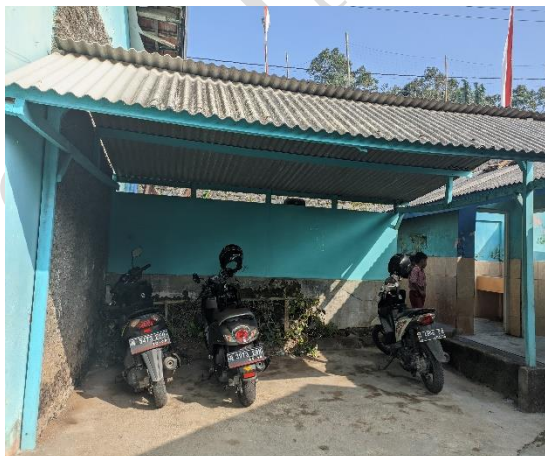
1.15 Tempat Parkir Guru