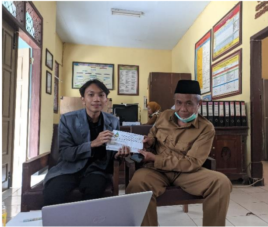
1.1 Penyerahan surat izin penelitian kepada kepala sekolah SMP Negeri 4 Ampelgading Satu atap