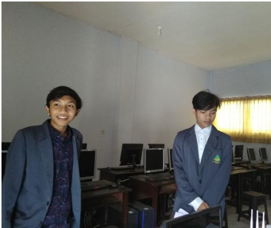
1.19 Lap Komputer Dan Server