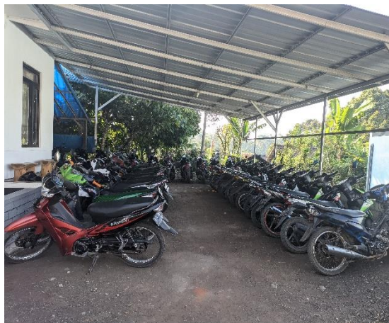
1.16 Tempat Parkir Siswa