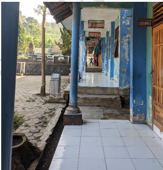
1.9 Lobi depan Kelas