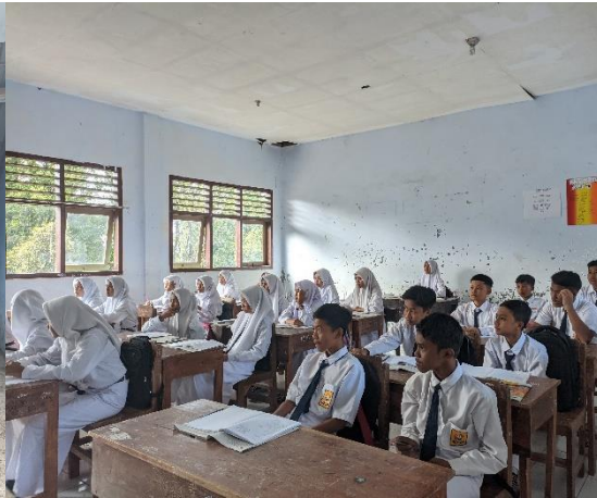
1.18 Kondisi pembelajaran Siswa