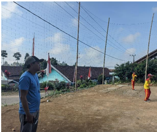
1.13 Lapangan Volly dan Badminton