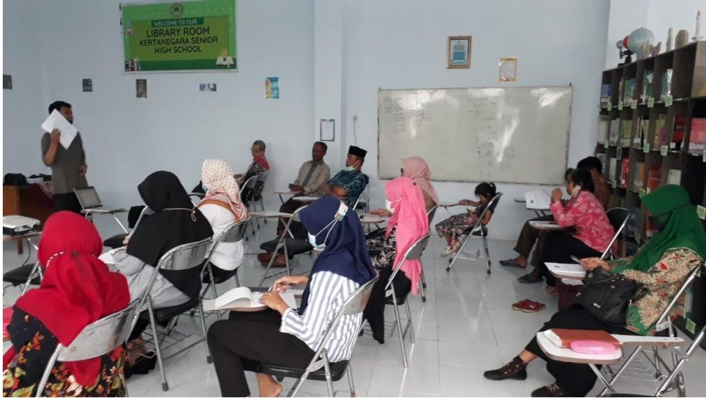
Gambar 6. Rapat Evaluasi Kinerja