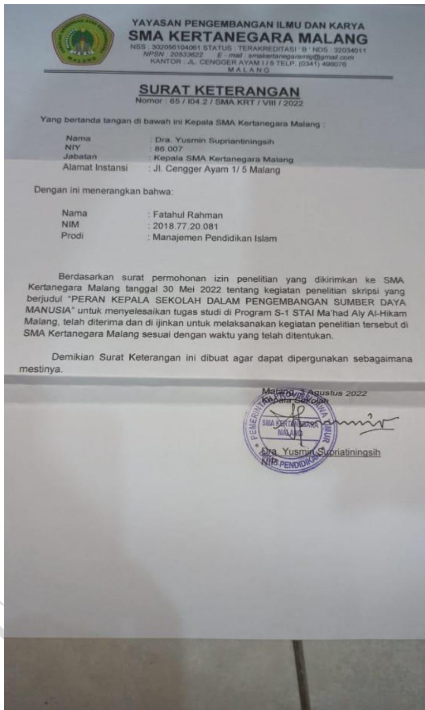
Gambar 2. Surat Keterangan Telah Melakukan Penelitian