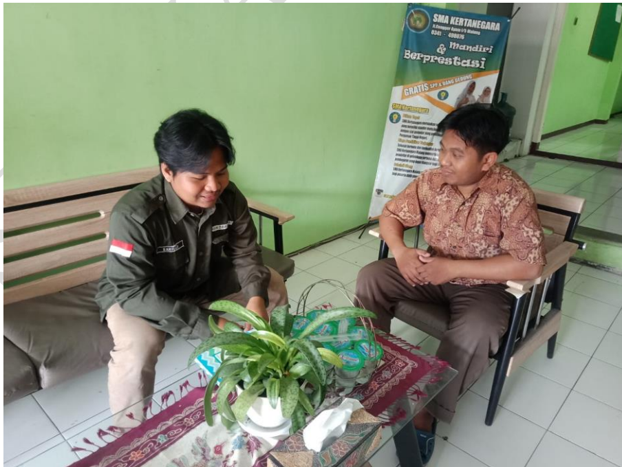
Gambar 2. Wawancara dengan pengurus dapodik sekaligus tata usaha sekolah