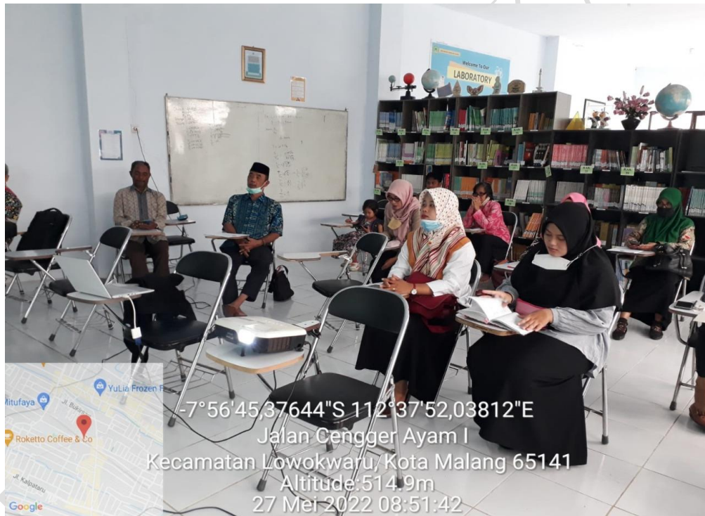
Gambar 7. Rapat tidak lanjut kurikulum