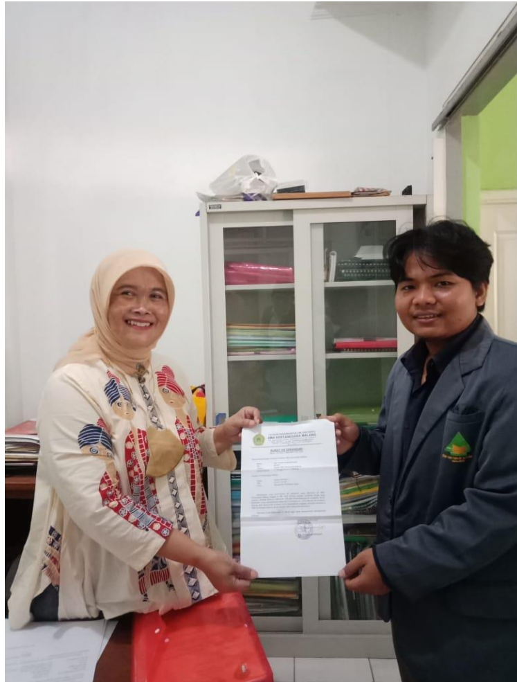
Gambar 1. Bersama kepala sekolah