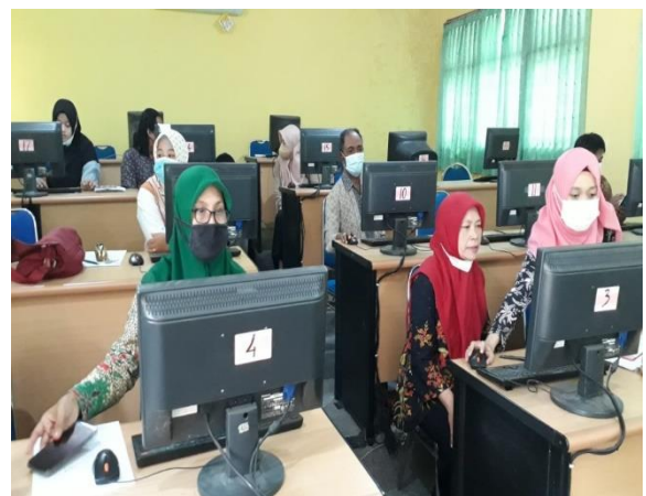
Gambar 5. Pelatihan pembelajaran Daring