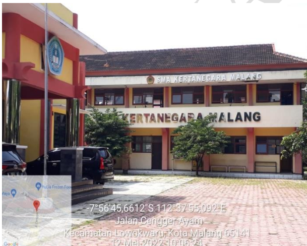
Gambar 4. Gedung sekolah