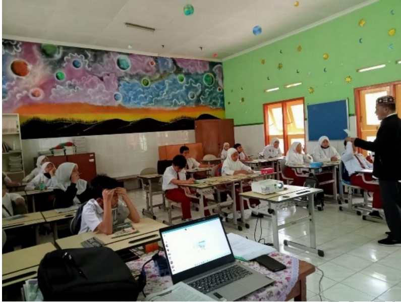
Gambar 1. Kegiatan pembelajaran guru PAI