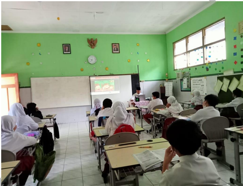
Gambar 4. Penayangan video animasi