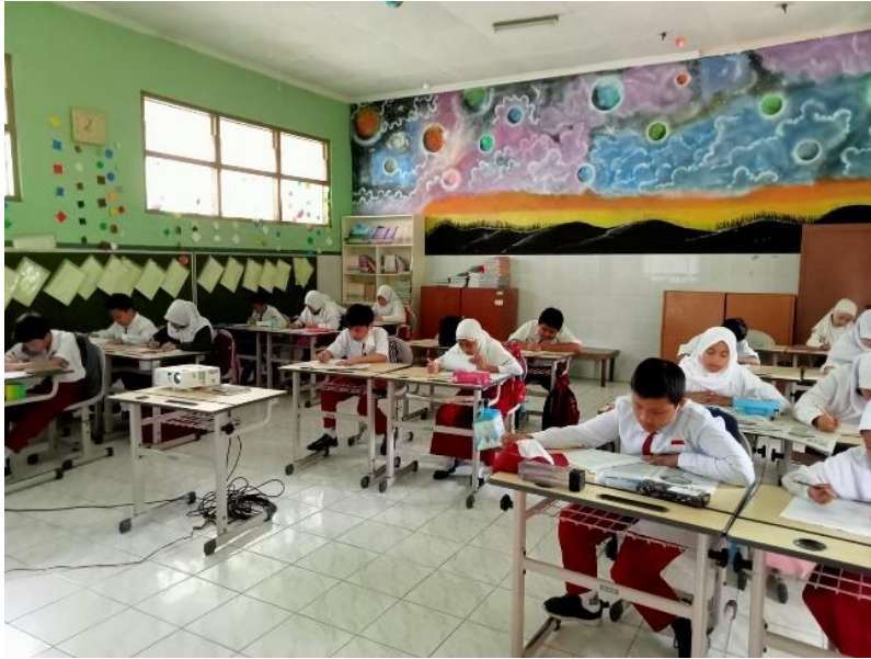
Gambar 3. Peserta didik mengerjakan soal pre-test