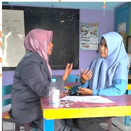
Wawancara dengan Guru TPQ Miftahul Huda