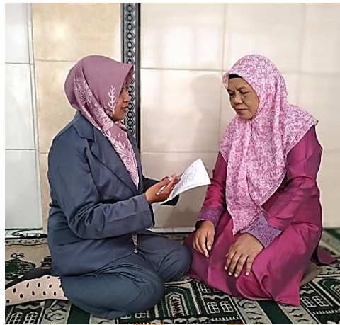
Wawancara dengan Kepala TPQ Miftahul Huda