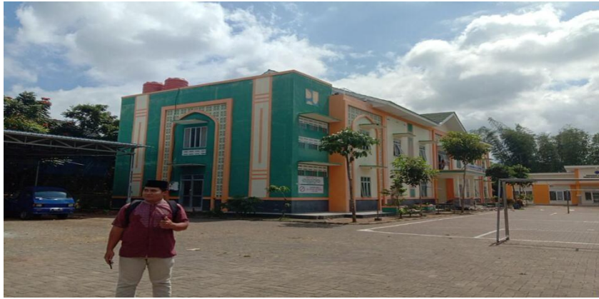
Asrama baru santri pondok pesantren Bahrul Maghfiroh