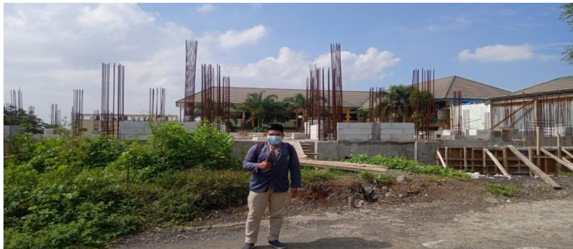
Lokasi Pembangunan Masjid baru Pondok Pesantren