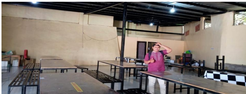
Ruang Makan Santri